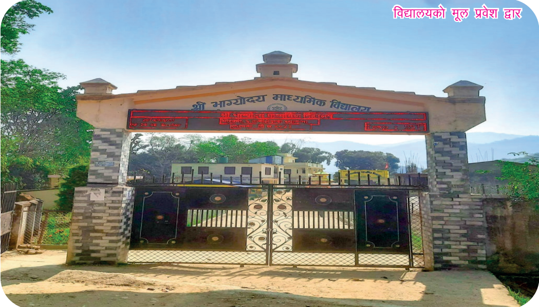
विद्यालयको मूल प्रवेश द्वार