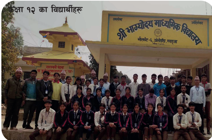
कक्षा १२ का विद्यार्थीहरू