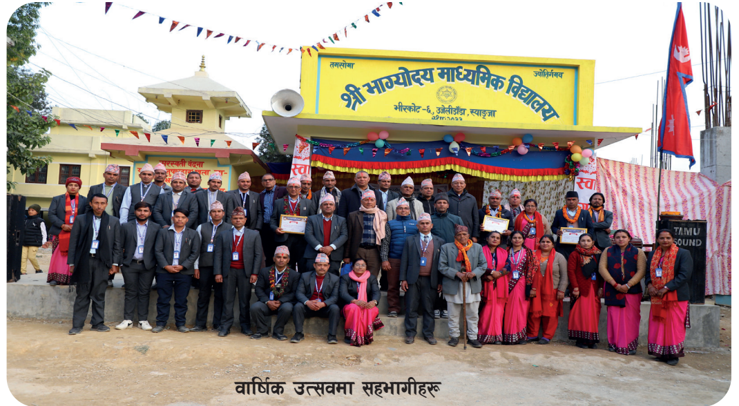
वार्षिक उत्सवमा सहभागीहरू