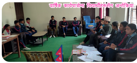
वार्षिक कार्यपत्रोमा विद्यार्थीहरूसँग अन्तर्क्रिया

सयौं थुँडंगा फूलका हामी एउटै माला नेपाली, सार्वभौम भई फैलिएका मेची महाकाली । प्रकृतिका कोटी कोटी सम्पदाको आँचल, वीरहरूका रगतले स्वतन्त्र र अटल । ज्ञानभूमी, शान्तिभूमी तराई, पहाड, हिमाल, अखण्ड यो प्यारो हाम्रो मातृभूमी नेपाल । बहुल जाती, भाषा, धर्म, संस्कृति छन् विशाल, अग्रगामी राष्ट्र हाम्रो जय जय नेपाल ।