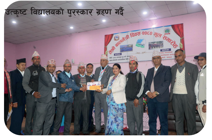
उत्कृष्ट विद्यालयको पुरस्कार ग्रहण गर्दै